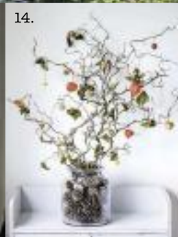
1. Abito con ricami dai colori accesi, Alexander McQueen. 2. Ha le nuance della natura il piatto/dipinto del ristorante del Relais & Châteaux Castel Fragsburg a Merano. 3. Segnaposto in legno. 4. Tavolo imperiale apparecchiato in mezzo al bosco, Il Fiore all'Occhiello. 5. e 9. Chalet immerso nel bosco del San Luis di Avelengo, a Bolzano, e un'inquadratura di una suite. 6. Stivali e colletto con ricami floreali, Vivetta. 7. Abito, Alberta Ferretti. 8. Sandali, Casadei. 10. Collo alto e maniche lunghe per l'abito tutto pizzo, Pronovias. 11. I colori del bosco per l'outfit castigato con maniche a campana, Erdem. 12. Una veduta esterna del Relais & Châteaux Castel Fragsburg a Merano. 13. trasparenze e ramage a tema bosco, Luisa Beccaria. 14. Una composizione tratta dal libro 'Natura in casa' di Louise Curley, Logos Edizioni.