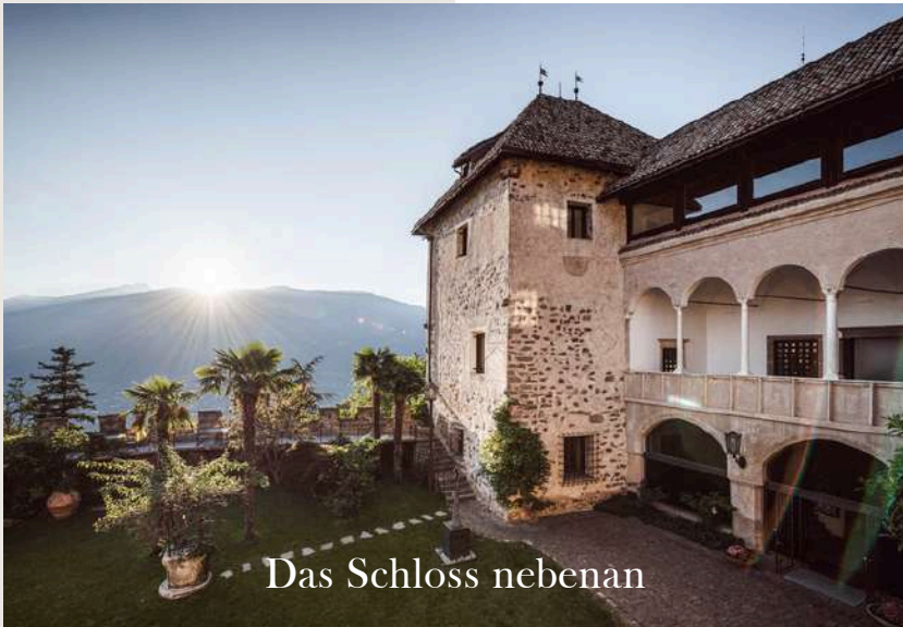
Das Schloss nebenan